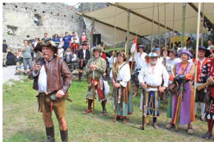
Waffenerklärung beim Ritterspektakel