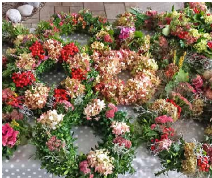
Herbstkränze zum Erntedanksonntag