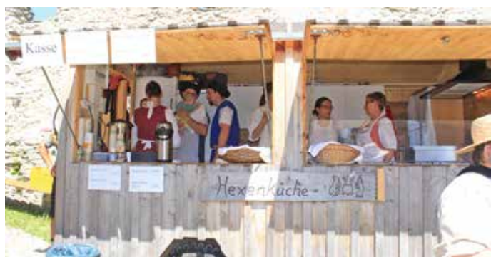
Allerlei Leckereien gab es in der Hexenküche