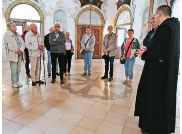
Zu Besuch im Klostermuseum der Benediktinerabtei Ottobeuren