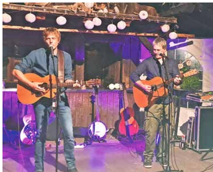
Die „Allgäuer Barden“-Musiker Blanz und Häcking in voller Aktion