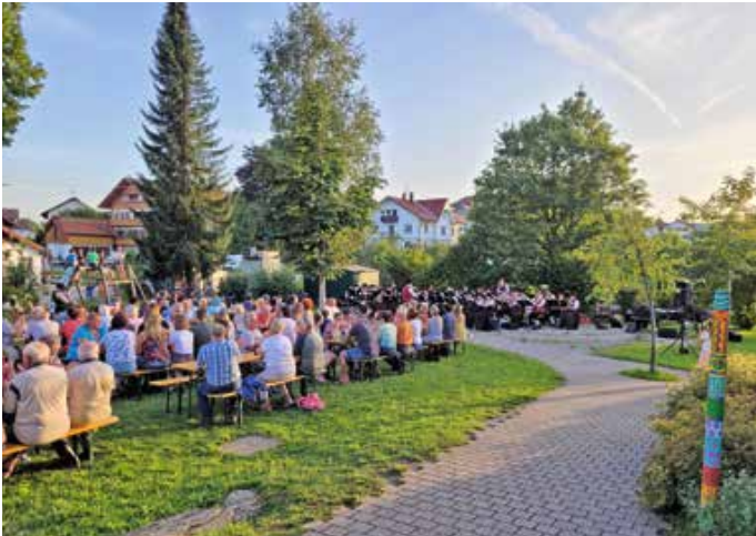
Das gut besuchte Standkonzert des Musikverein Lengenwang