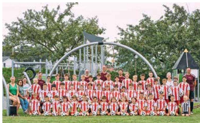
BFV-Fußballcamp 2024

Der Redaktions- und Anzeigenschluss für das VGem-Blatt vom 15. Oktober 2024 ist Freitag, 27. September 2024, 12 Uhr.