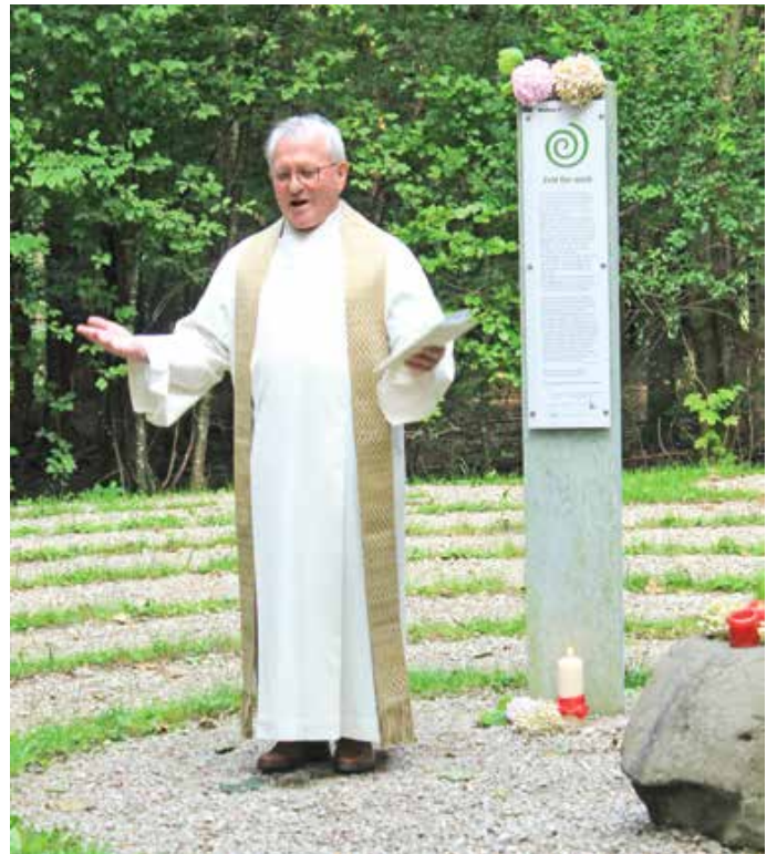
Monsignore Alois Linder bei der Abendandacht