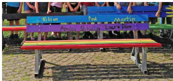
Eine der fertigen Bänke