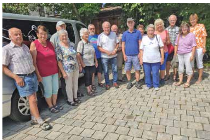
Ausflug zur Allgäuer Zeitung in Kempten

Wir bedanken uns bei der Gemeinde Lengenwang, die uns den Gemeindebus zur Verfügung gestellt hat und besonders bei der Pfarrgemeinde Lengenwang, die die Kosten für den zweiten Bus übernommen hat. Von: Luise Hiemer