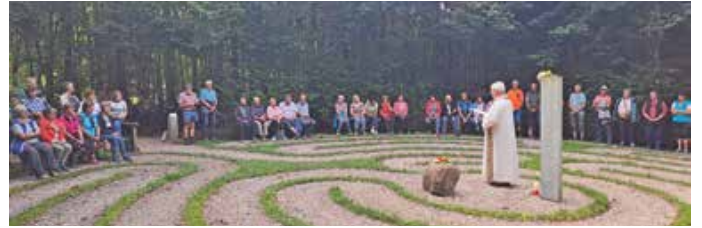
Bei der Abendandacht im Labyrinth