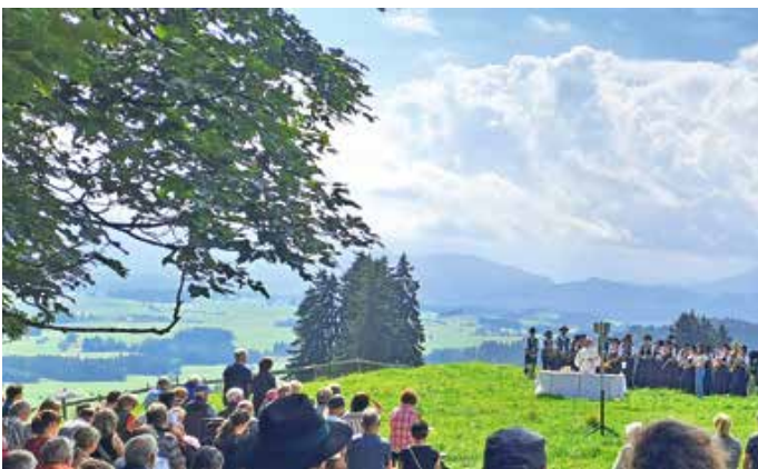
Bergmesse der Musikkapelle Wald bei der Schlossbergalm