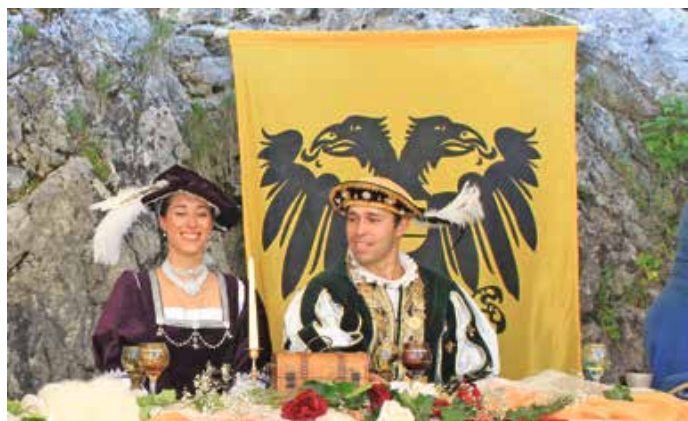
Das Kaiserpaar am Ehrentisch