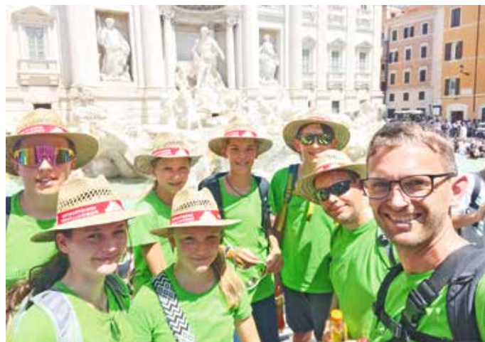
Die Rückholzer Minis vor dem Trevi Brunnen in Rom