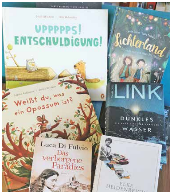
Die neuen Bücher in der Bücherei Seeg

Öffnungszeiten: dienstags 9 - 11 Uhr, donnerstags 15.30 - 18.30 Uhr, samstags 10 - 12 Uhr