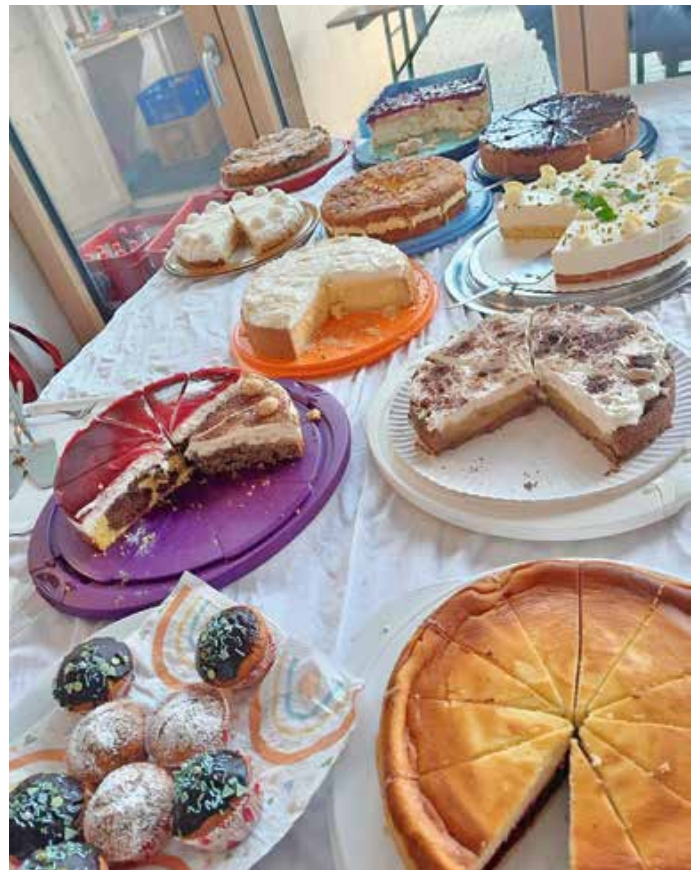
Kuchenauswahl – Fotos: Hanni Purschke