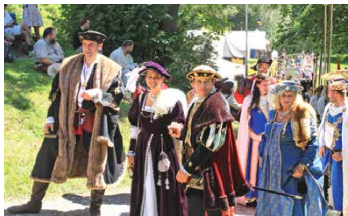
Das Kaiserpaar und der Markgraf