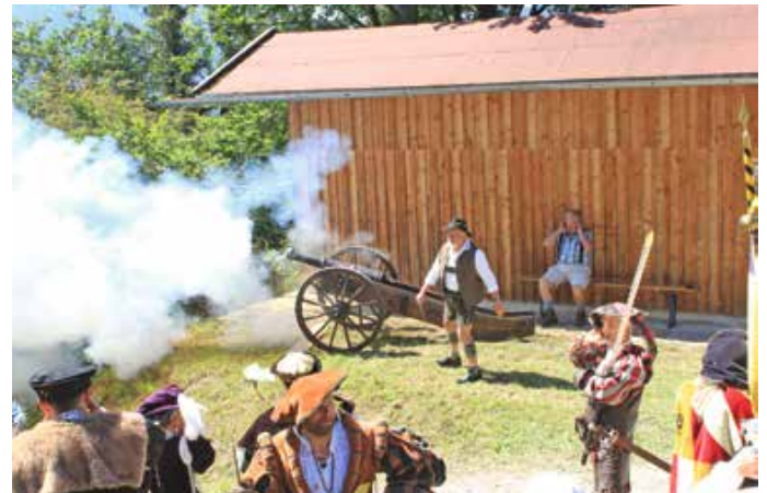
Kanonenschüsse beim Mittelalterspektakel