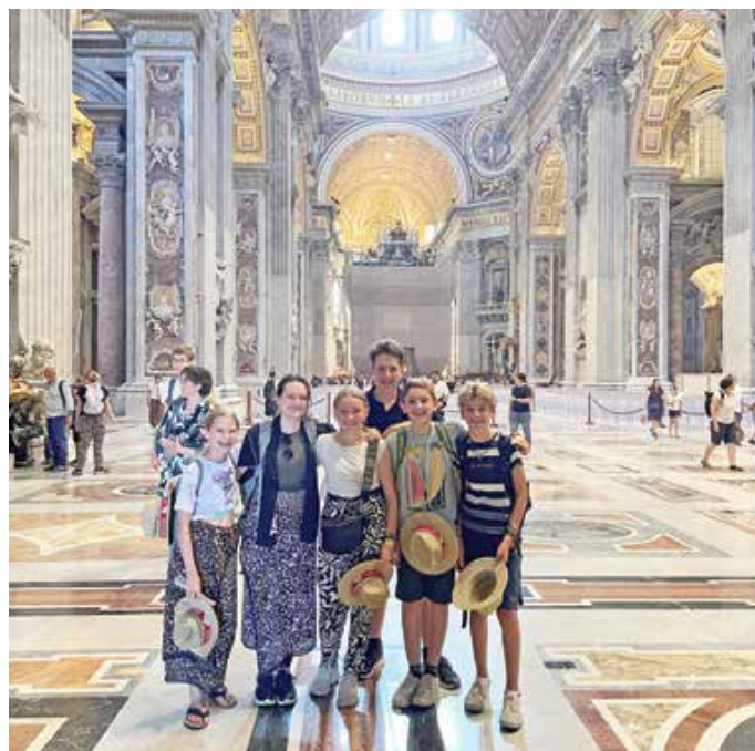
Die Rückholzer Minis im Petersdom