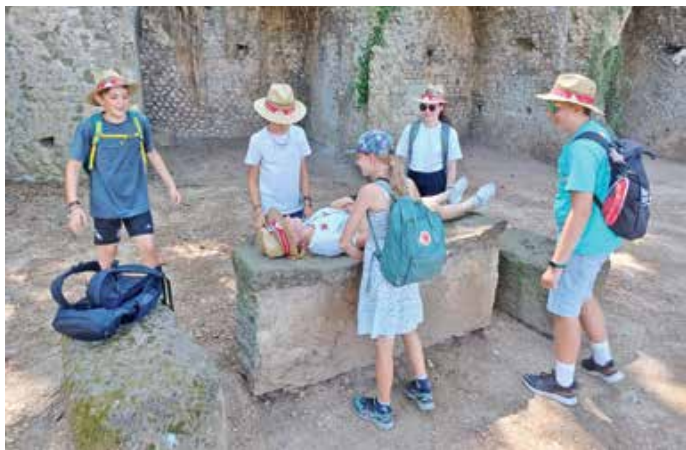
Ein toller Ministrantenausflug in Rom

Sitzplätze während der Audienz. „Dieser Abend war ein einzigartiges Erlebnis, da man den Papst von ganz nah sehen konnte. Außerdem fand ich es sehr schön, dass wir eine Gemeinschaft im Chor waren. Ich bekomme immer noch Gänsehaut, wenn ich an diesen Abend denke, wie wir vor ca. 50.000 Ministranten und Ministrantinnen mit einer unbeschreiblichen Atmosphäre gesungen haben!“, so die Aussage einer Teilnehmerin aus Rückholz. Gefüllt mit schönen Erlebnissen kehrten wir in unser Hotel zurück.