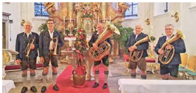
Die Wildsteiger Weisenbläser