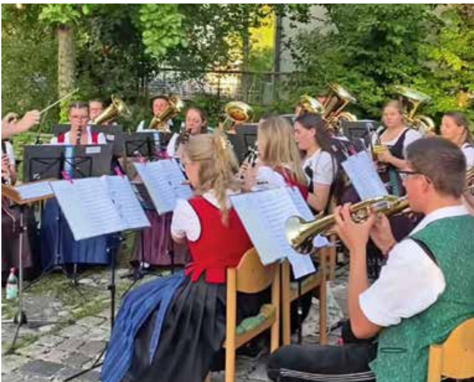
Die VG Kapelle spielte beim Sommerfest in Wald auf