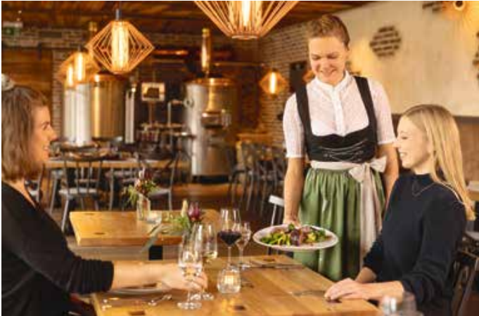
Allgäuer Genusstage 2024 – Foto: Landkreise Ost- und Unterallgäu

Vom 23. September bis 6. Oktober 2024 starten die Allgäuer Genusstage im Ostallgäu und Unterallgäu in die sechste Runde. Dabei laden 92 Gastronomen, Landwirte und handwerkliche Verarbeiter dazu ein, die Region von ihrer kulinarischen Seite kennenzulernen und zu erleben. Das langfristige Ziel des Netzwerks steht dafür, mehr Lebensmittel aus der Region in der heimischen Gastronomie zu verwenden und damit regionale Wirtschaftskreisläufe zu stärken.