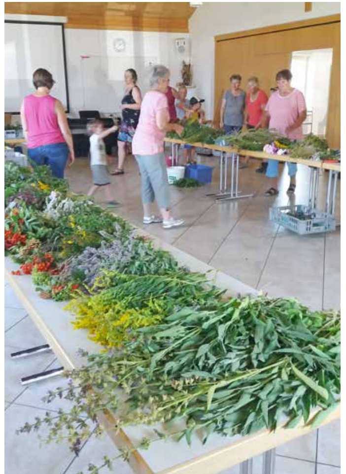
Die fleißigen Helferinnen bei der Vorbereitung