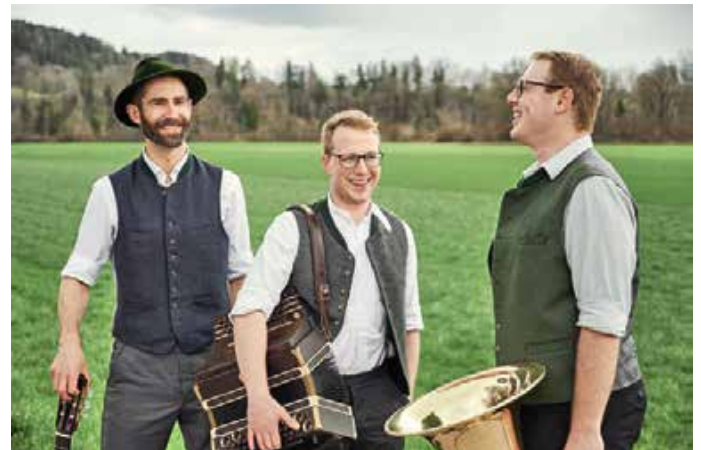
Die Dreiecksmusi kommt nach Wald in die Waldhalla

Der Redaktions- und Anzeigenschluss für das VGem-Blatt vom 15. Oktober 2024 ist Freitag, 27. September 2024, 12 Uhr.