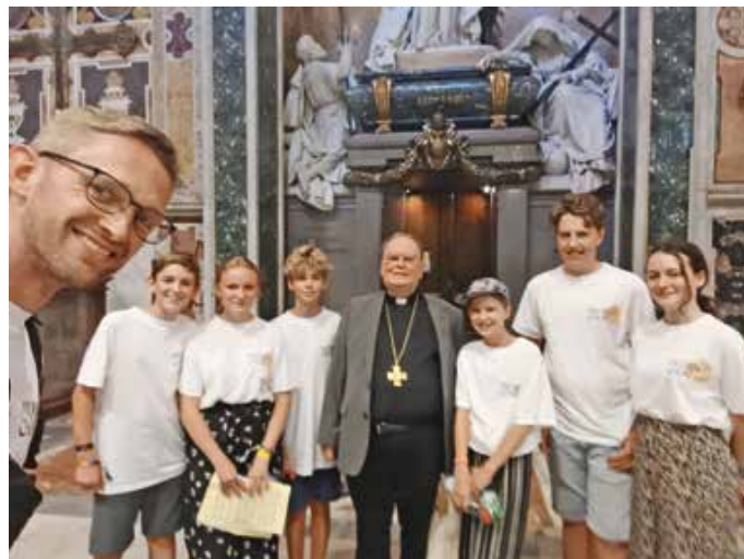
Zu Gast im Vatikan