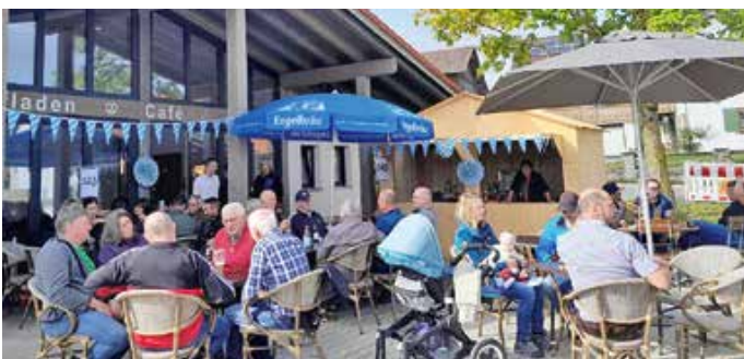
Gäste des Hoffestes 2023

Das Team freut sich auf Euren Besuch. Von: Gemeinde Wald