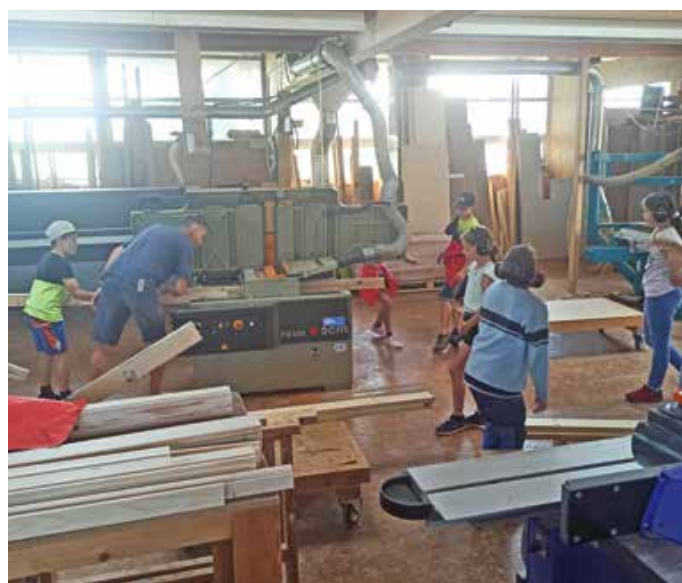
In der Schreinerei packen die Schüler der 4b fleißig mit an