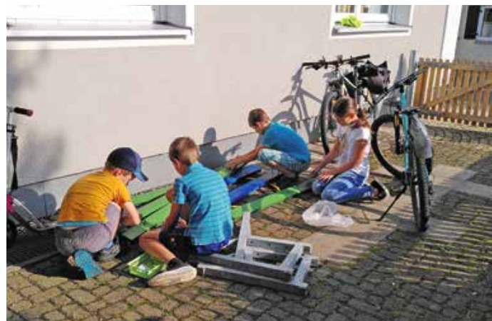
Restoration der Schulbänke im Pausenhof