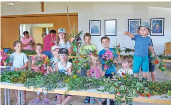
Die Kinder freuen sich über ihre gelungenen Werke