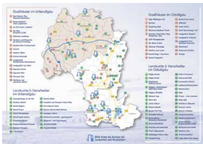
Karte Allgäuer Genusstage – Copyright: Landratsamt Ostallgäu Kreisentwicklung

Aus der Vielfalt von den hochwertigen und regionalen Lebensmitteln, die die Erzeuger aus dem Ostallgäu und Unterallgäu den teilnehmenden Gastronomen zur Verfügung stellen, werden während der Genusstage ganz besondere Gerichte zubereitet. Gäste können sich von traditionellen und ausgefallenen Zusammenstellungen überraschen lassen und in urigen Wirtschaftshäusern, gutbürgerlichen Gaststätten oder gehobenen Restaurants auf die Genussvielfalt freuen. Das Besondere dabei ist, dass Interessierte direkt auf der Speisekarte erfahren, von welchem Landwirt oder handwerklichen Verarbeiter aus der Region die Lebensmittel stammen.