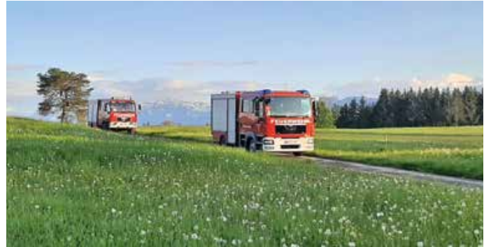
Die Feuerwehr Lengenwang lädt ein.