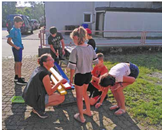
Restoration der Schulbänke