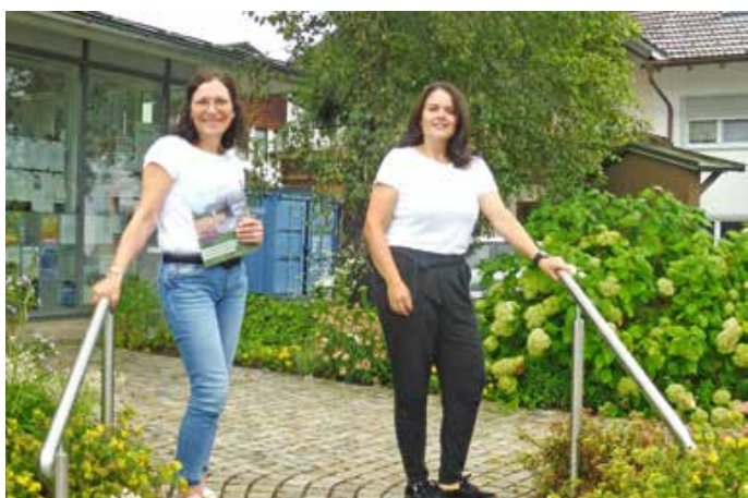
Die Mitarbeiterinnen der Gemeindeverwaltung begutachten das neue Geländer