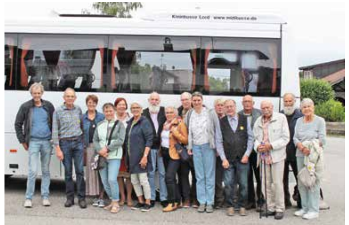
Ausflug des Museumsvereins Seeg e. V.